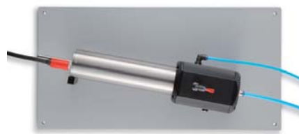
Проточная камера, смонтированная на стене